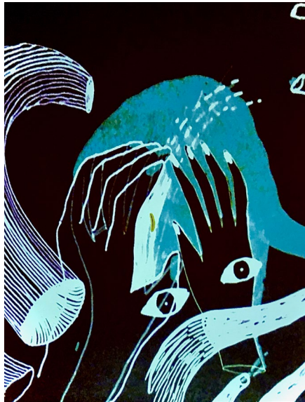
© Fanny Alet et Raphaël Decoster

Vernissage de l'exposition « Street » + Fresque et performances