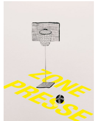
Dessin : Lauriane Belin

Retrouvez l'artiste Raphaël Decoster avec son groupe Turfu lors de la soirée clôture du festival (21.11)