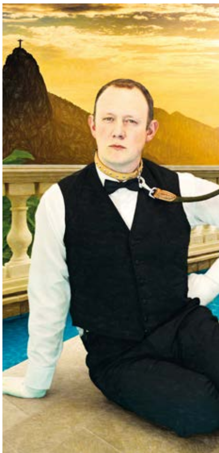
Greg Houben © Racasse Studio