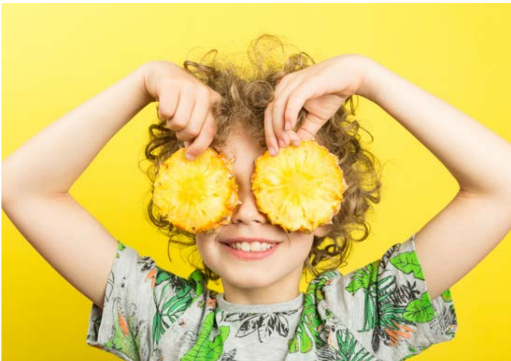
© Zoé Menu / David Bormans