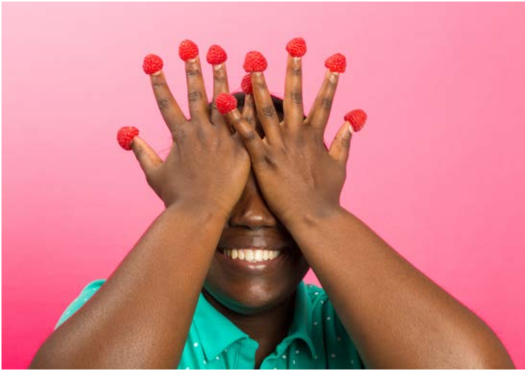
© Zoé Menu / David Bormans