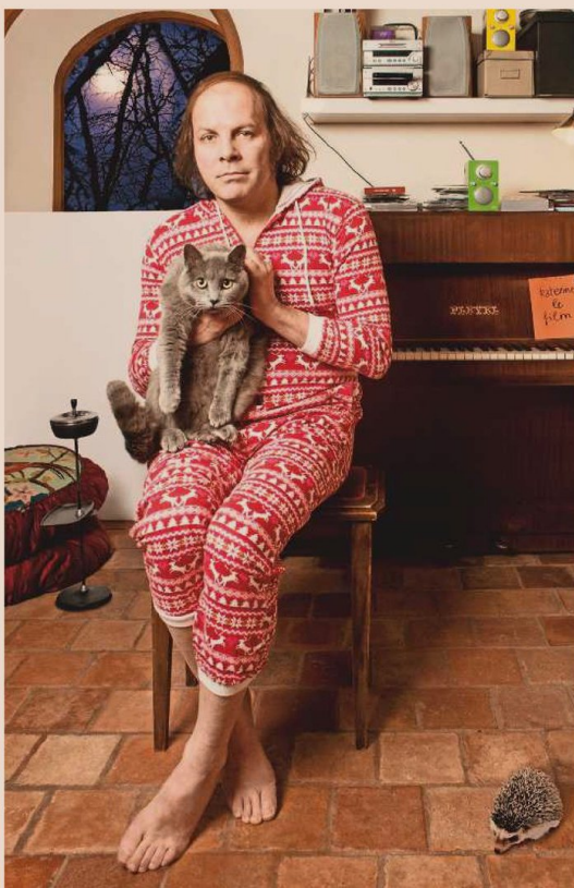
Philippe Katerine, tête d'affiche du Festival au Carré.

Ainsi et pour la toute première fois, le festival utilisera l'espace quelque peu confiné (une quarantaine de places à peine) mais tout en rondeur de la Tour Valenciennoise.