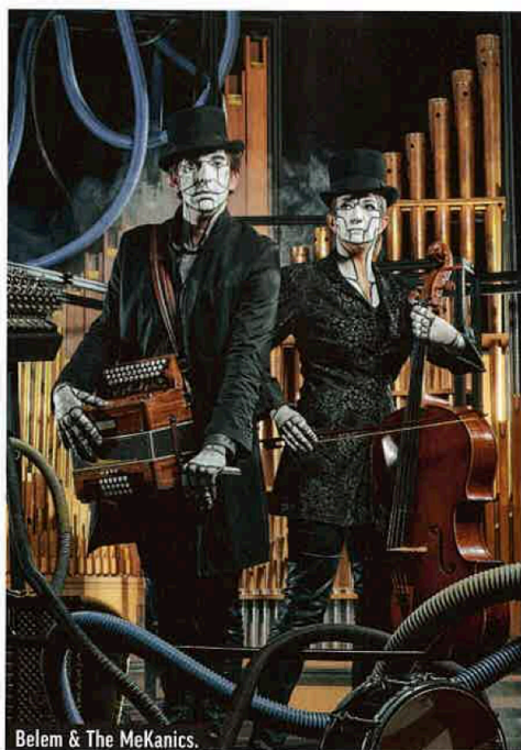
Belem & The MeKanics.