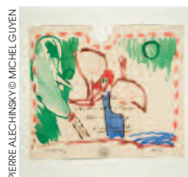
PIERRE ALECHINSKY © MICHEL GUYEN

OÙ: AU CENTRE DE LA GRAVURE, LA LOUVIÈRE PRIX: 7 EUROS INFOS: WWW.CENTREDELAGRAVURE.BE