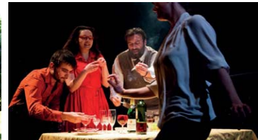
Une soirée aux accents du Sud.