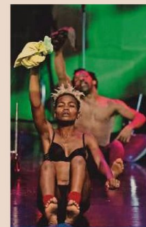
Kalakuta Republik.